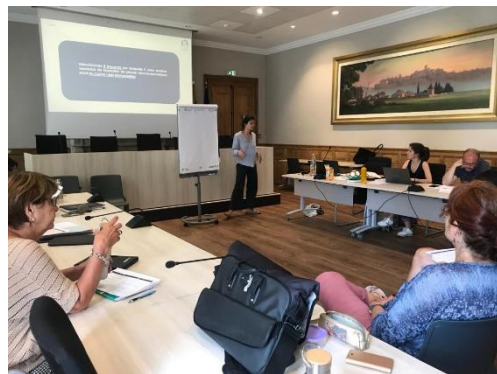
Diagnostic cyclabilité participatif réalisé le 3 mars 2022 (à gauche) et atelier de priorisation des impacts potentiels du projet réalisés le 16 mai 2022 (à droite)